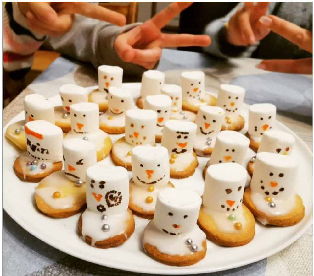
zu Hause gebacken von Carla & Maja

150g Puderzucker etwas Wasser pro Plätzchen 1 Marshmallow Zuckerstift in Orange Zuckerstift in Braun Zuckerperlen für die Knöpfe